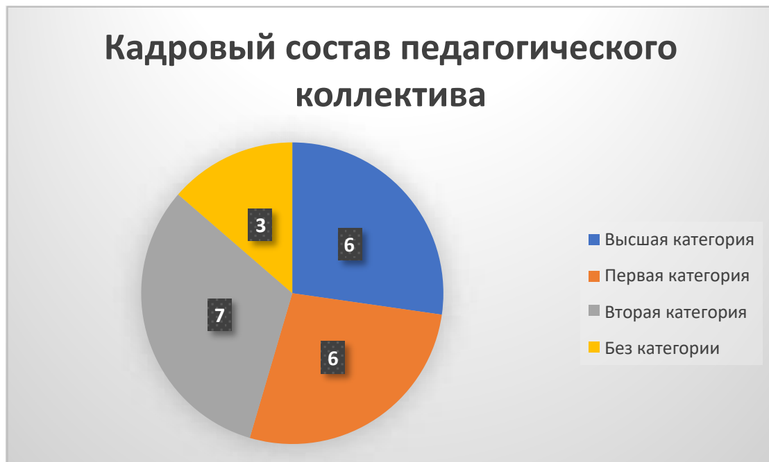
Рисунок 5. Кадровый состав педагогического коллектива (на 01.09.2020 г.).

На рисунке 5 показан качественный состав педагогического коллектива.