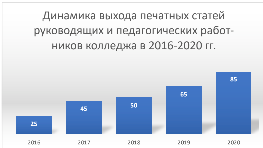
Рисунок 6. Динамика выхода печатных статей руководящих и педагогических работников колледжа в 2016-2020 гг.

Тиражирование, популяризация и обобщение педагогического опыта, руководящие и педагогические работники систематически освещают в печатных и электронных изданиях разного уровня. Динамика печатных статей руководящих и педагогических работников колледжа представлена на рис. 6.