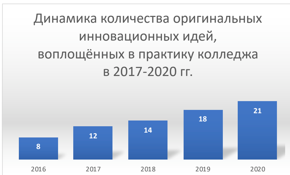
Рисунок 7. Динамика количества оригинальных инновационных идей, воплощённых в практику колледжа в 2016-2020 гг.

Увеличение показателей на рисунке 7 демонстрируют готовность руководящих и педагогических работников к реализации инновационных проектов. Мобильность, обучаемость, системность работы управленческого аппарата и педагогического коллектива позволяют успешно внедрять в образовательную практику колледжа социальные, творческие, профориентационные проекты, построенные на основе сетевого взаимодействия, инновационные процедуры оценки качества профессиональной подготовки студентов колледжа, принимать участие в конкурсах профессионального мастерства и т.д.