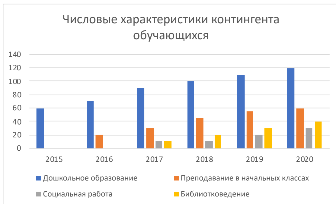
Рисунок 2. Числовые характеристики контингента обучающихся.

Для оценки показателей в области числовых характеристик контингента обучающихся, обратимся к таблице 3.