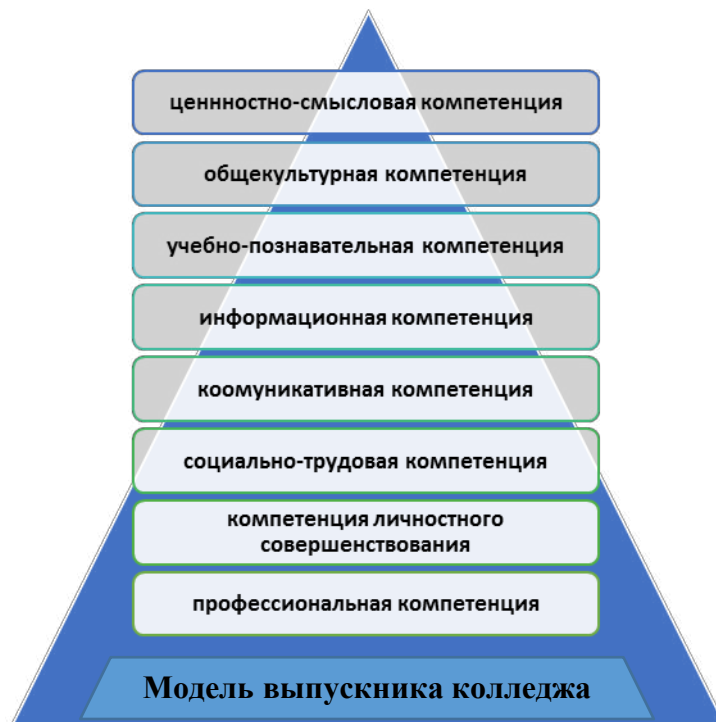
Рисунок 8. Компетентностная модель выпускника Шахтерский педагогический колледж

1. Ценностно-смысловая компетенция. Она связана с ценностными ориентирами студента, его способностью видеть и понимать окружающий мир, разбираться в нем, осознавать свою роль, Уметь выбирать целевые и смысловые установки для своих действий и поступков, принимать решения. Обладающий этой компетенцией студент приобретает способность самоопределения в ситуации учебной и/или профессиональной деятельности. От нее зависят индивидуальная траектория обучающегося, выпускника и программа его жизнедеятельности в целом.