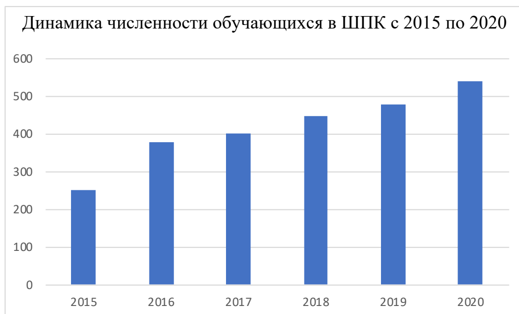
Рисунок 1. Динамика численности обучающихся в Шахтерском педагогическом колледже с 2015 г. по 2020 г.

Динамика общей численности обучающихся за последние 3 года представлена на рисунке 1.